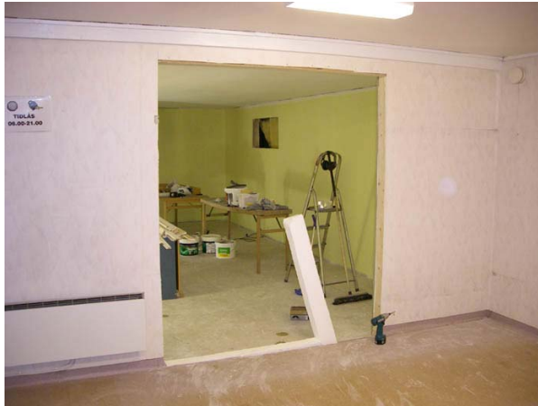
Så här ser det ut idag från gamla omklädningsrummet.

Onsdag den 3/3 Det stora som hänt är att valvet mellan nya och gamla rummet har tagits upp. Taket är spacklat en gång till och målat, väggarna målas ännu en gång. Bernt började att ta upp och sätta fönstret i nya delen. Det fick flyttas lite. Bänkbräderna målas också men de blir bara fler och fler så det tar nog tid.