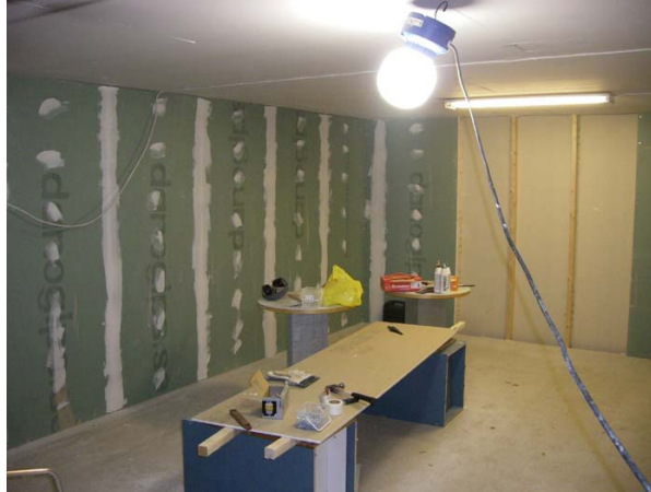
Där längst bort kommer valvet mot gamla omklädningsrummet

Detta gjorde vi, hann dessutom med att ta upp hål för fönster och började spackla.