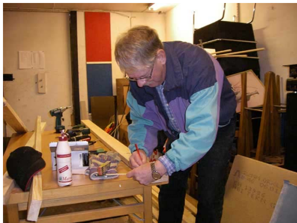
Bänkspecialisten Ström i farten.

Onsdag den 17/2 Vi fortsatte med spackel och slipning. Tak- och golvlister målades en gång till. Vi fortsatte också såga till bräder till bänkarna i omklädningsrummet, och skruva ihop några.