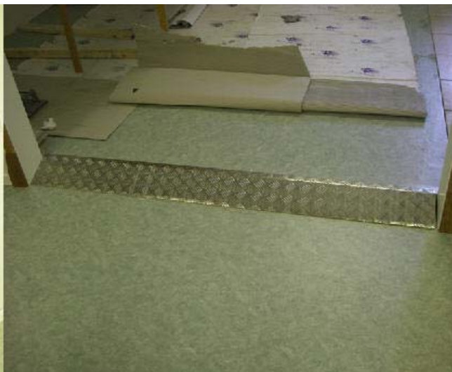
Plåt-Arne har levererat en plåt igen