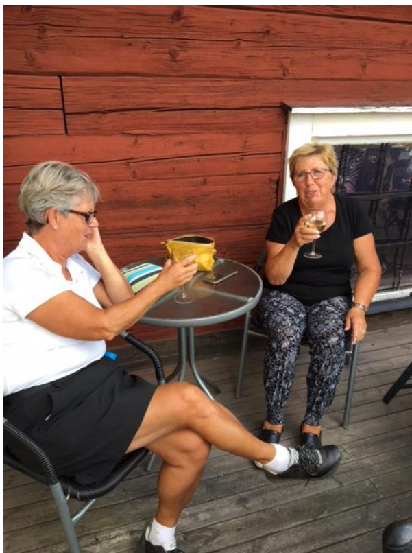
Även kvällen var fin då det var dags att gå hem.