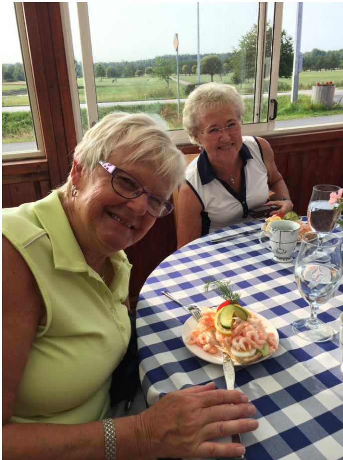
Visst ser det gott ut.