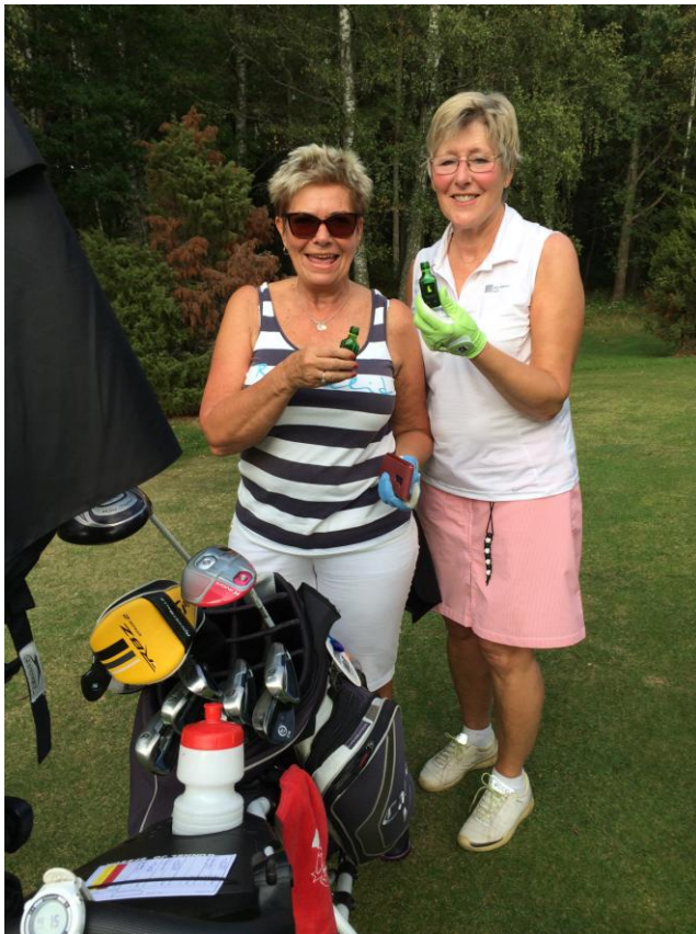
En del är riktigt på gång, det kan ju bli en birdie.