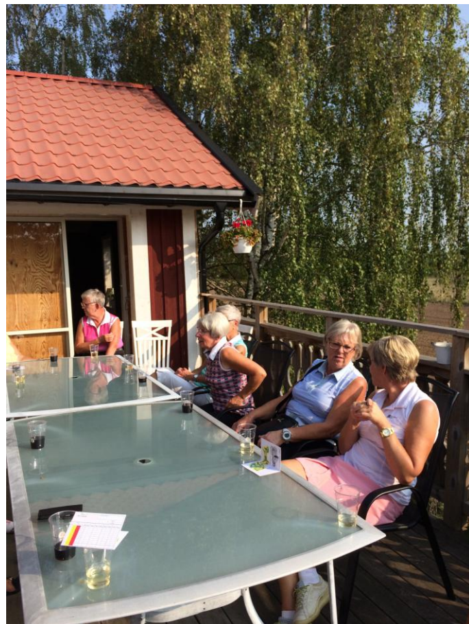
Samling och preparering vid husen, innan vi går ned till räkmackan