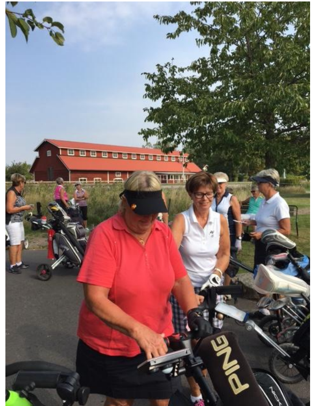
Nu är vi redo för spel.