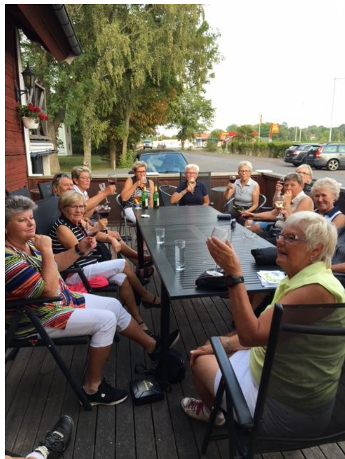
Nu har alla spelat färdigt och det är dags för mat.