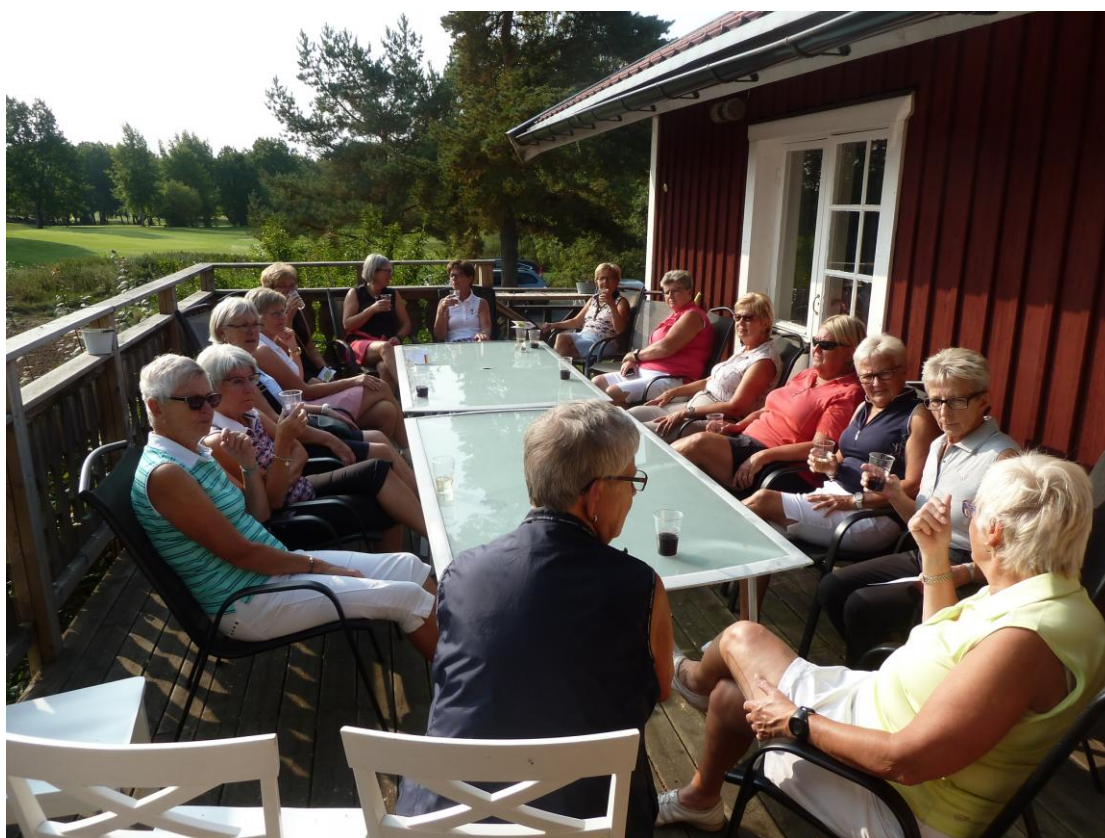
Första gången vädret har tillåtit att vi kan sitta här.