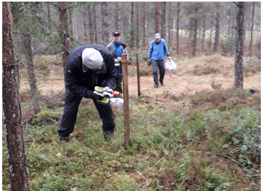
Här skruvas märklar för fullt till viltstängslet. 2/11