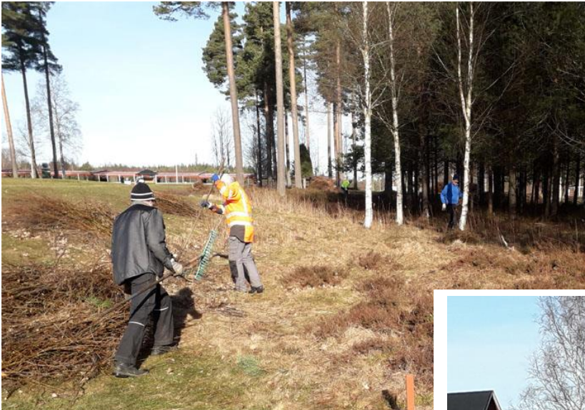
Röjning efter röjarnas framfart under vintern