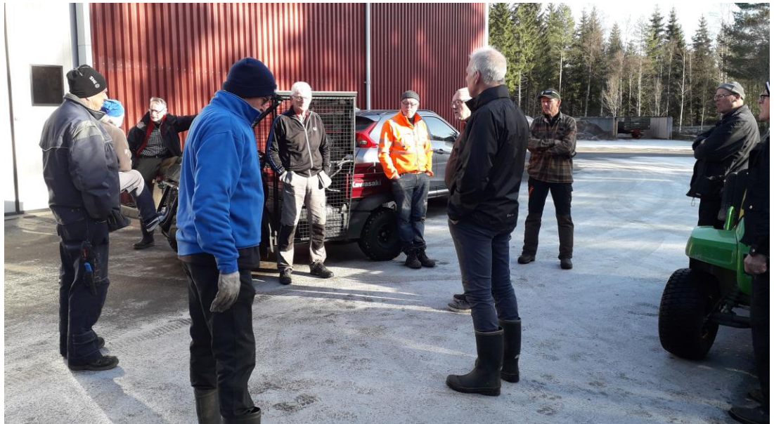
Snön har nästan försvunnit och solen kommer fram, då är det dags igen. 2/3