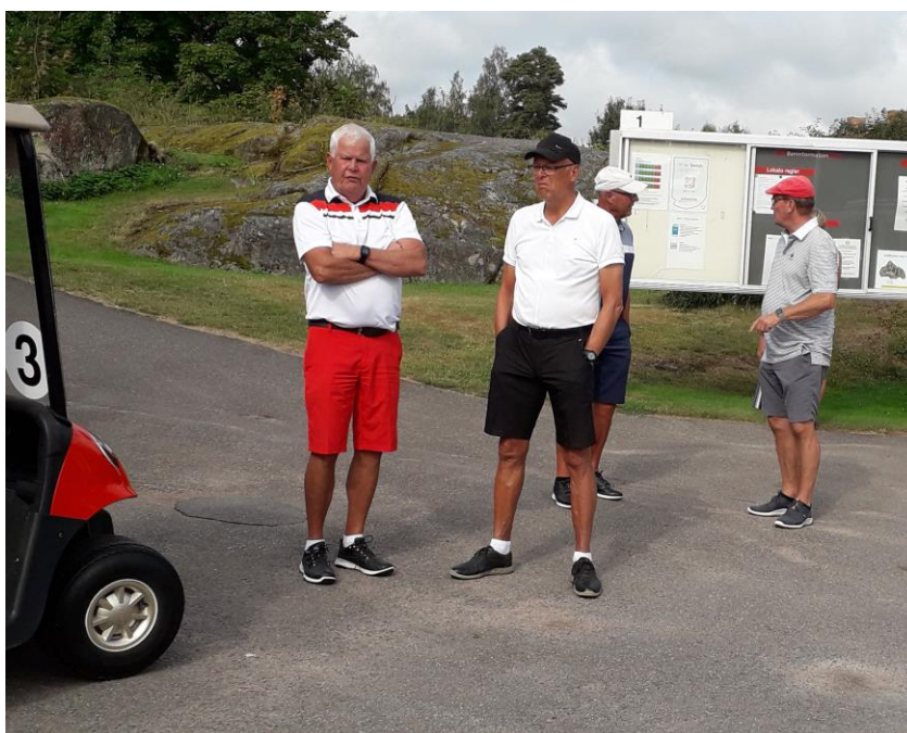
Väntan på att starttiden skall infinna sig.