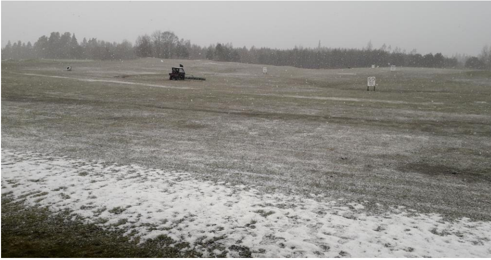
I dag var det inte lätt att hitta bollarna. 13/4

Resa till Mjölby för alla som jobbar på tisdagarna 28/7