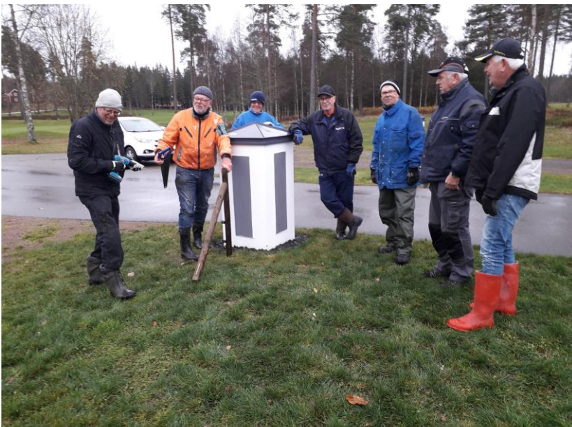
Så även den 9/11 Ja alla skruvade inte.