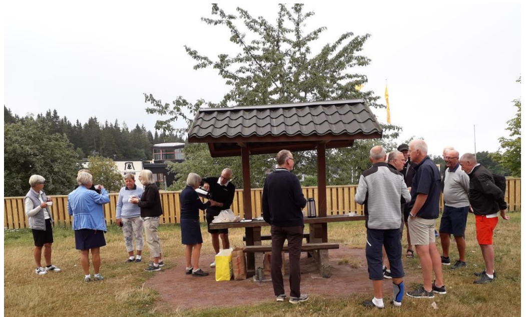
Fikapaus vid Gyllene Uttern.

Resa till Mjölby för alla som jobbar på tisdagarna 28/7