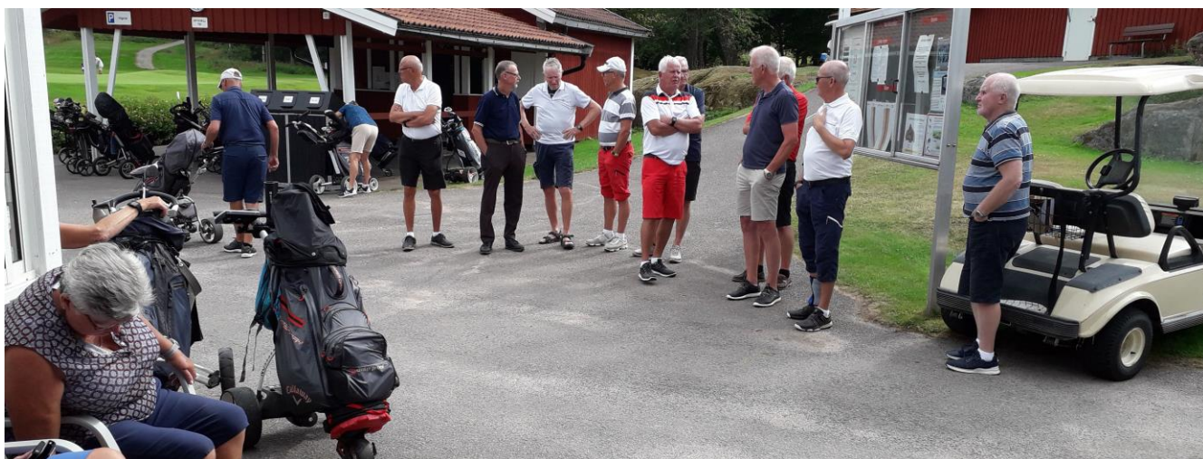
En del fick sitta, andra fick stå under prisutdelningen.