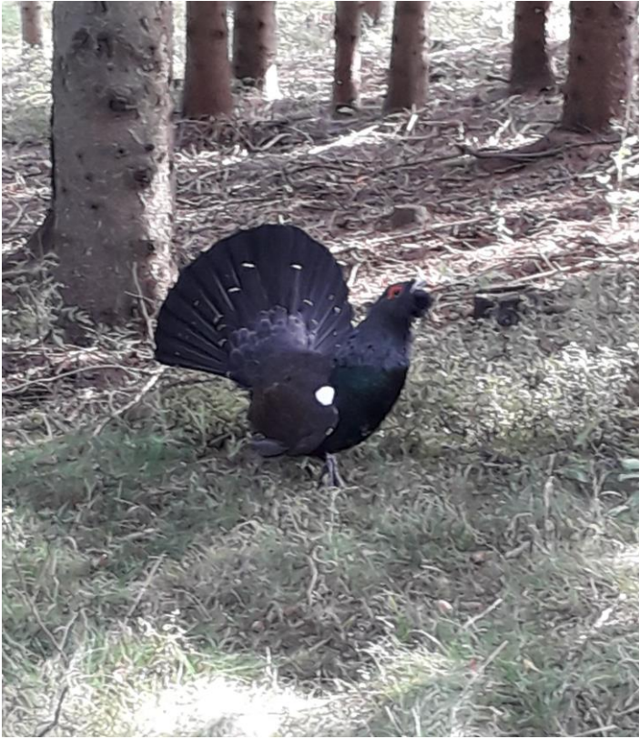
Den här arga krabaten väste när man kom för nära., 24/8