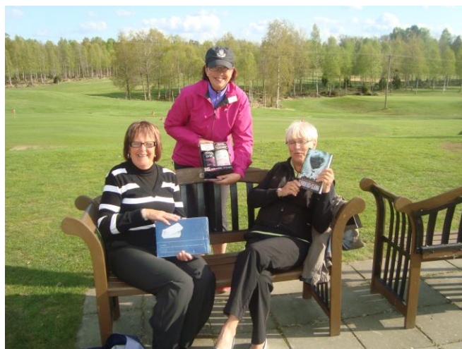
Glada damer som vunnit.