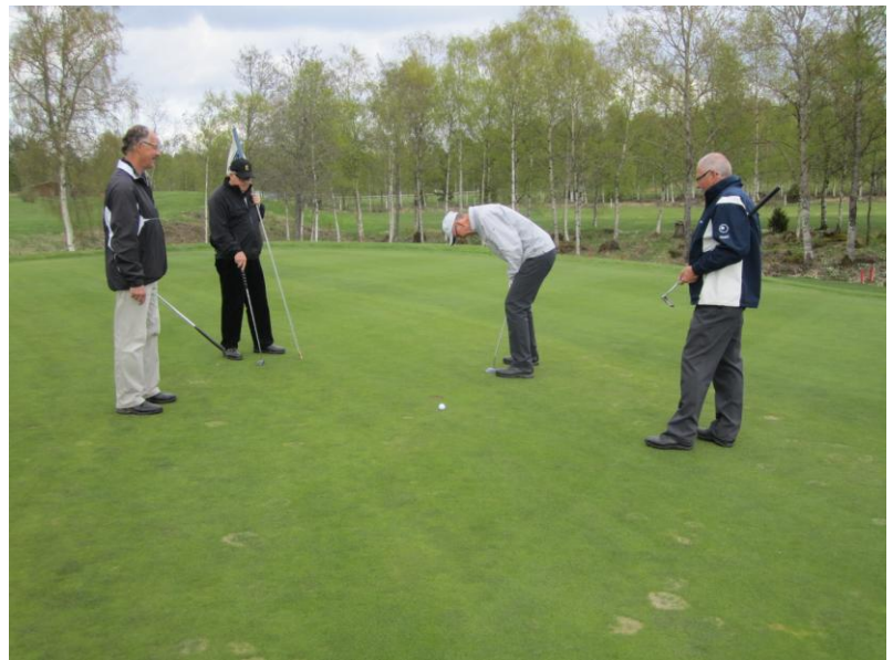
Det gäller den Bosse också