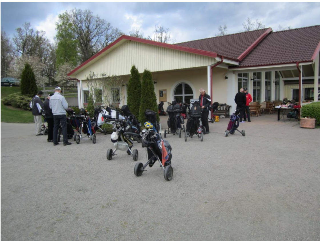
Nu börjar det komma in flera bollar och fisksoppan hägrar. (Den var fantastiskt god)