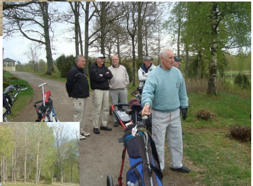
Kent undrar vilken klubba han skall ta