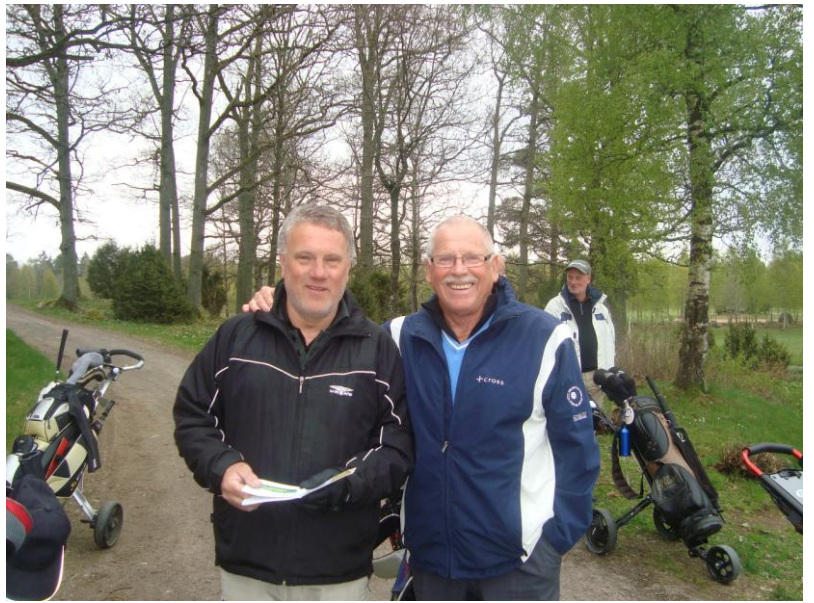
Två glada herrar som snart skall slå ut.