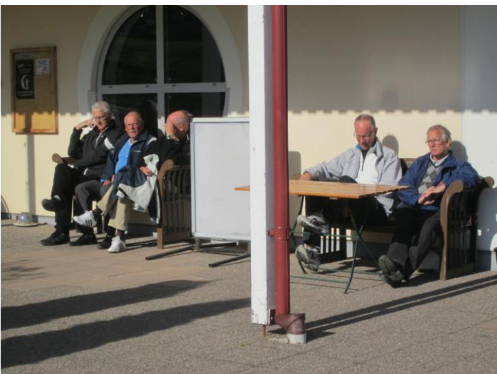
Många väntade på om det skulle bli någon utdelning.