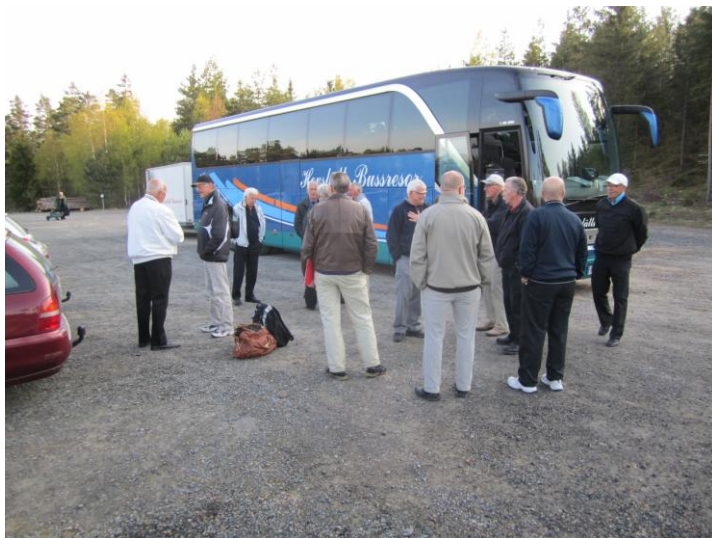
Resan började klockan 07:30 med samling på parkeringen på Skinnarebo