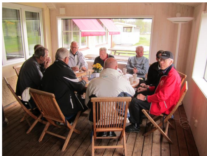
Väl framme i Herrljunga bjöds det på kaffe och fralla.