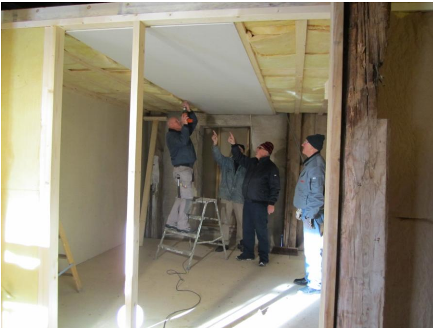
Här går det undan !! Isolering av tak och en rad gips på plats.

Titta vi behöver inte lyfta honom. Han kan ju använda stege !!!!