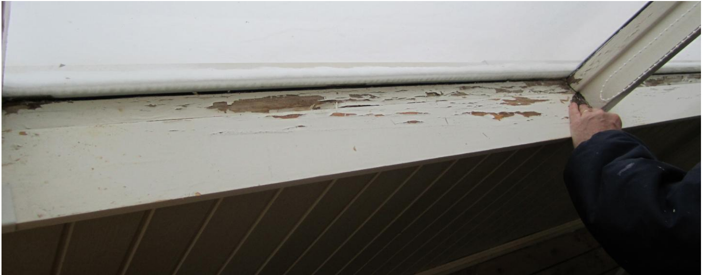
Restaurangens uterum har försetts med plåt på fönsterbrädorna.