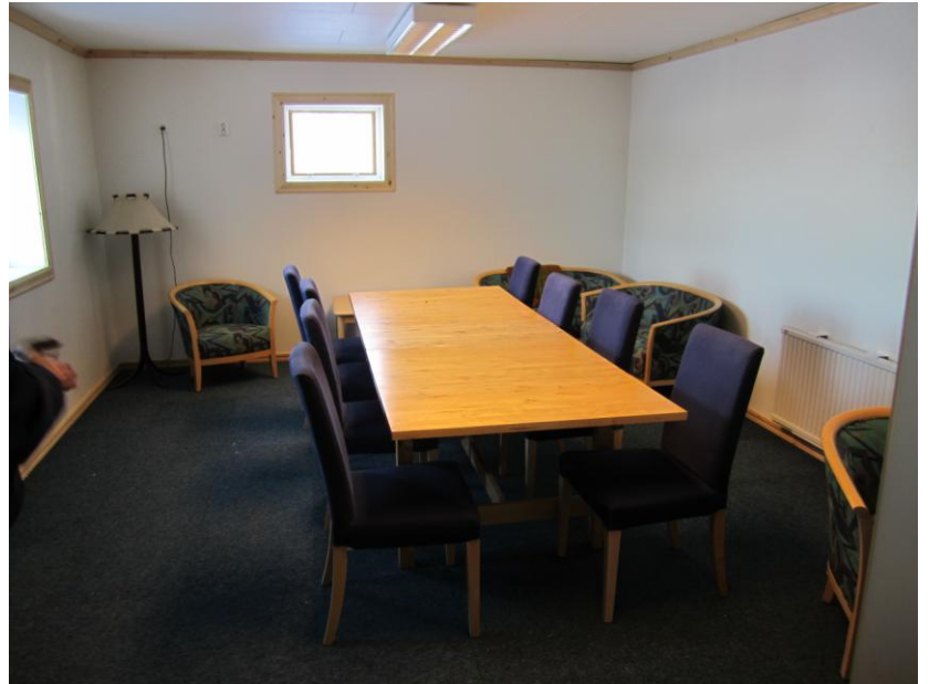
Klubbens nya sammanträdesrum som kan användas av alla olika kommittéer.