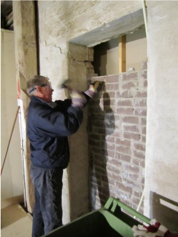
Gammal igenmurad dörr skall bli som ny.