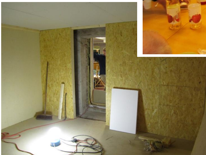
Så här ser det ut nu inifrån.