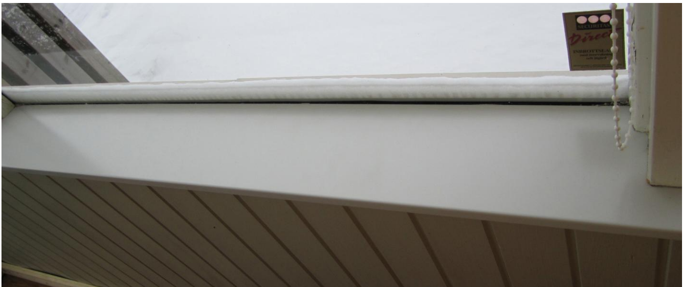
Visst blev det snyggt !!!