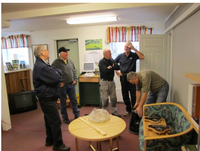
I kansliet är fondväggen klar, och beundras av ett gäng hantverkare.