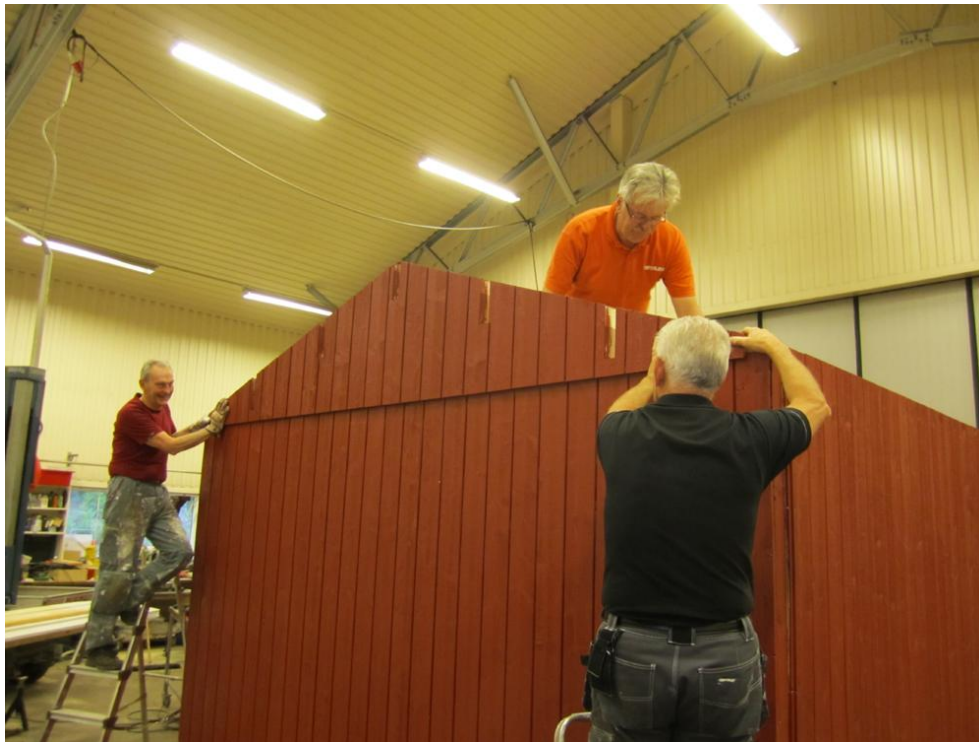
Fjärde huset och sista gaveln kommer på plats