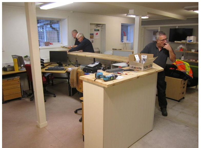
Den "nya" disken är på plats.