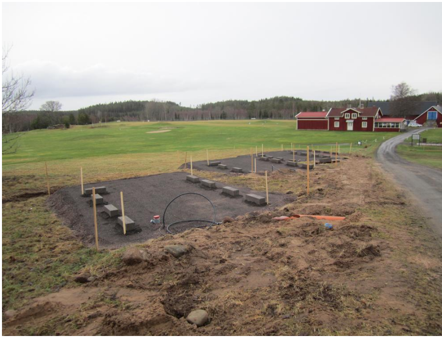
Här skall de stå med utsikt mot hål 10 och 11.