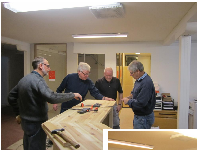
Fattas det en millimeter ??