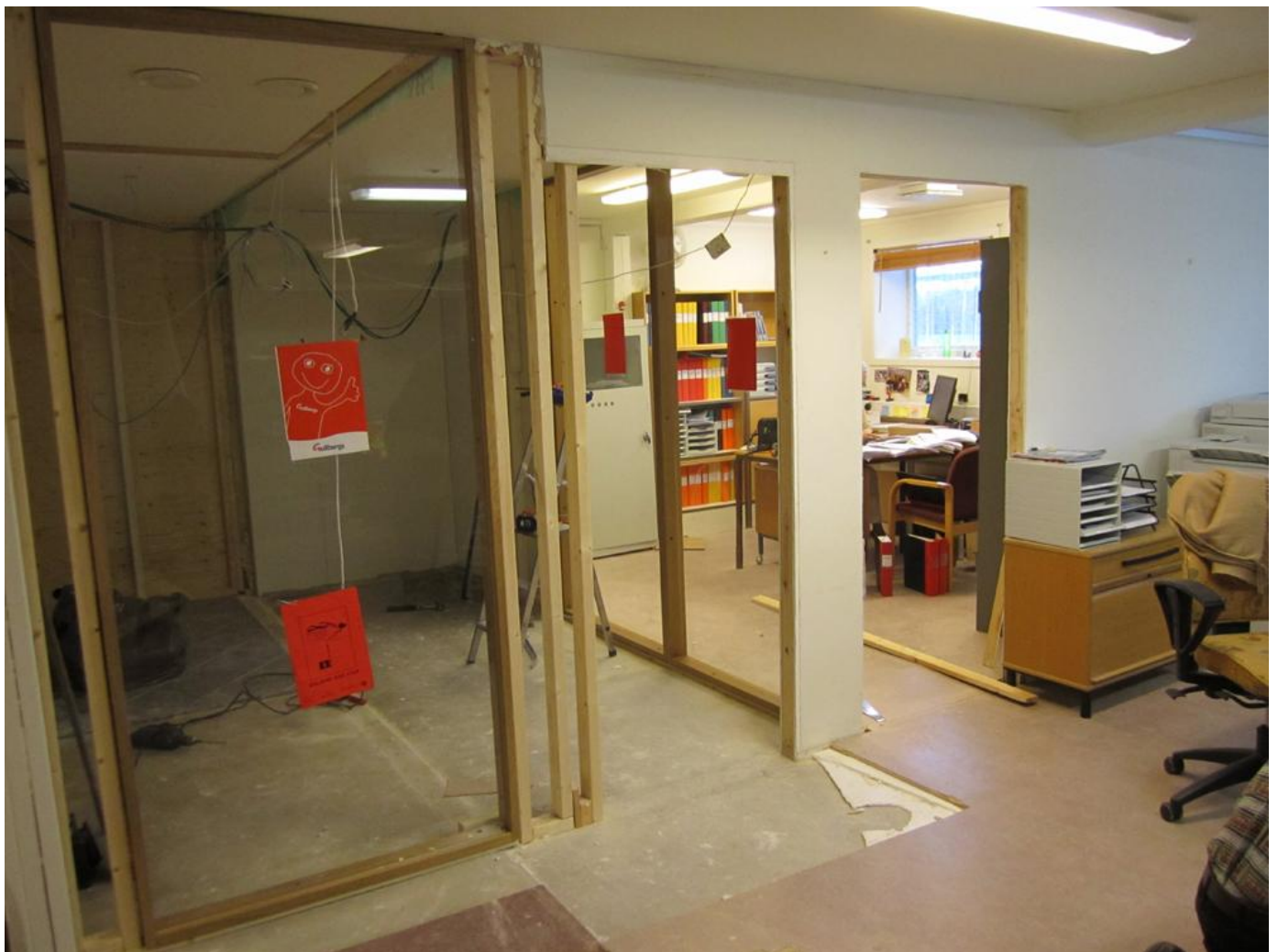
Nu är fönsterpartierna på plats i nya kontorsrummet.