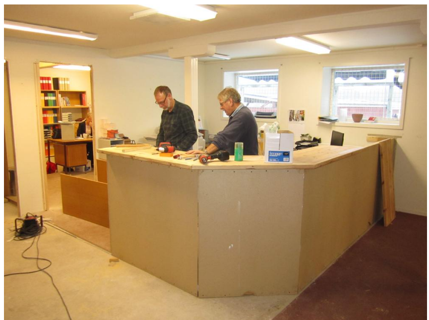
Nya krympta disken på plats.