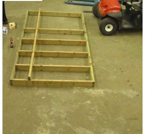
Även husens verandor byggs inomhus.