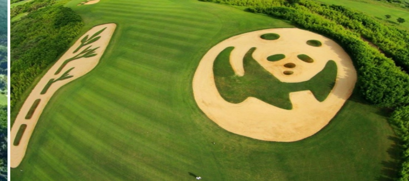
Resort med 10 (!) Golfbanor.